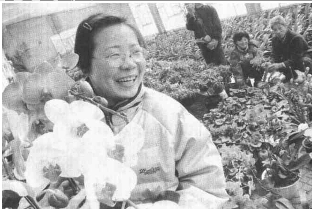
春节将至，我市各大花卉中心货源充足，购销两旺。各式鲜花五彩缤纷、姹紫嫣红，透着春的气息。除了进口凤梨、跳舞兰等时兴样品外，国产蝴蝶兰、君子兰、一品红等也非常畅销。